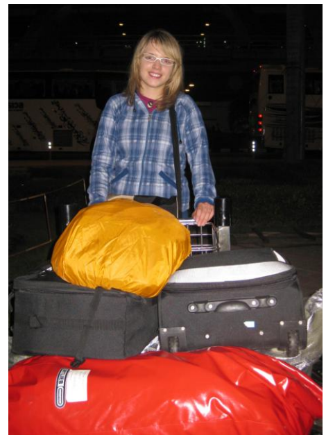
In Bangkok ich zusammen mit unserem Gepäck