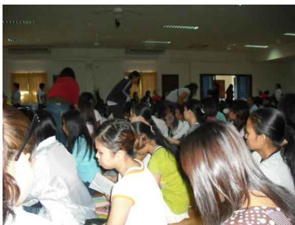
Bilder aus der Meeting Hall

Es werden verschiedene Dinge besprochen und am Ende jedes Meetings das wunderschöne Lied: than shii wit plaeng (Fountain of Life Song) und das Lied des Königs.