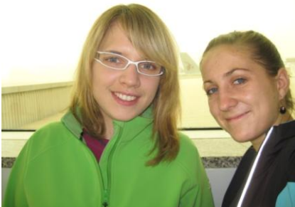
Aufenthalt in Doha

Unsere Reise in den Friedensdienst begann am Nachmittag mit einer Zugfahrt vom Stuttgarter Hauptbahnhof zum Flughafen in Frankfurt.