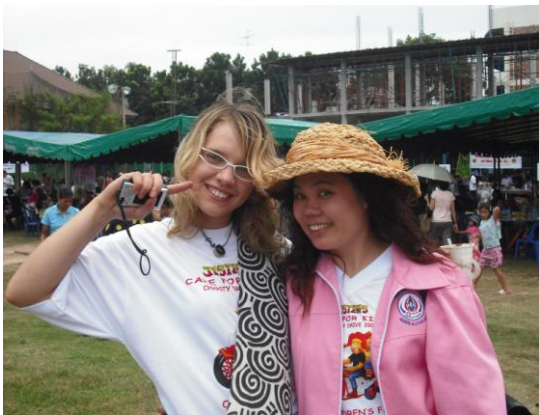
Ich und P Tik

Einen Bericht und Bilder finden Sie hier: http://leo-in-thailand.jimdo.com/bilder-1/jester-s-day/